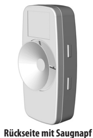
Rückseite mit Saugnapf